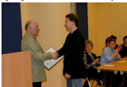
Zerifikatübergabe am 17.02.2004

nen Abläufe und organisatorischen Regelungen zu dokumentieren, zu analysie-